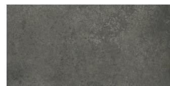
GRAFTON ANTHRACITE PR3060LB