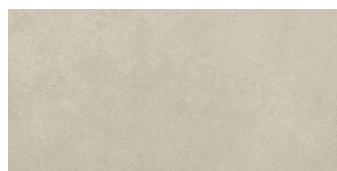
GRAFTON IVORY RECTIFICADO PR3060LB