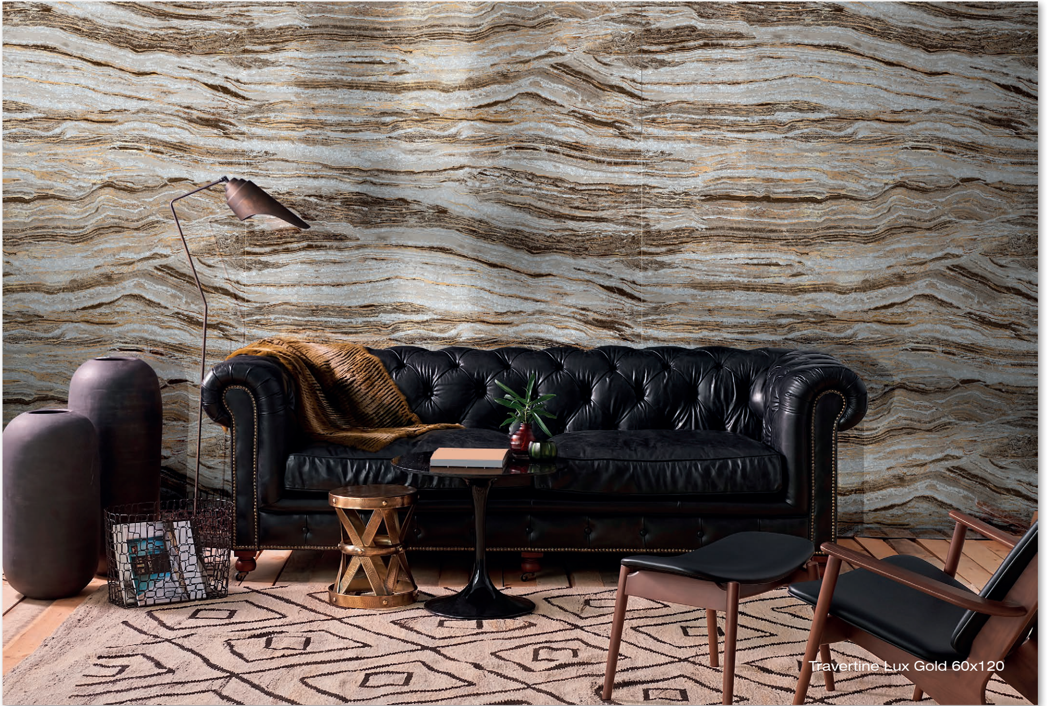
Travertine Lux Gold 60x120