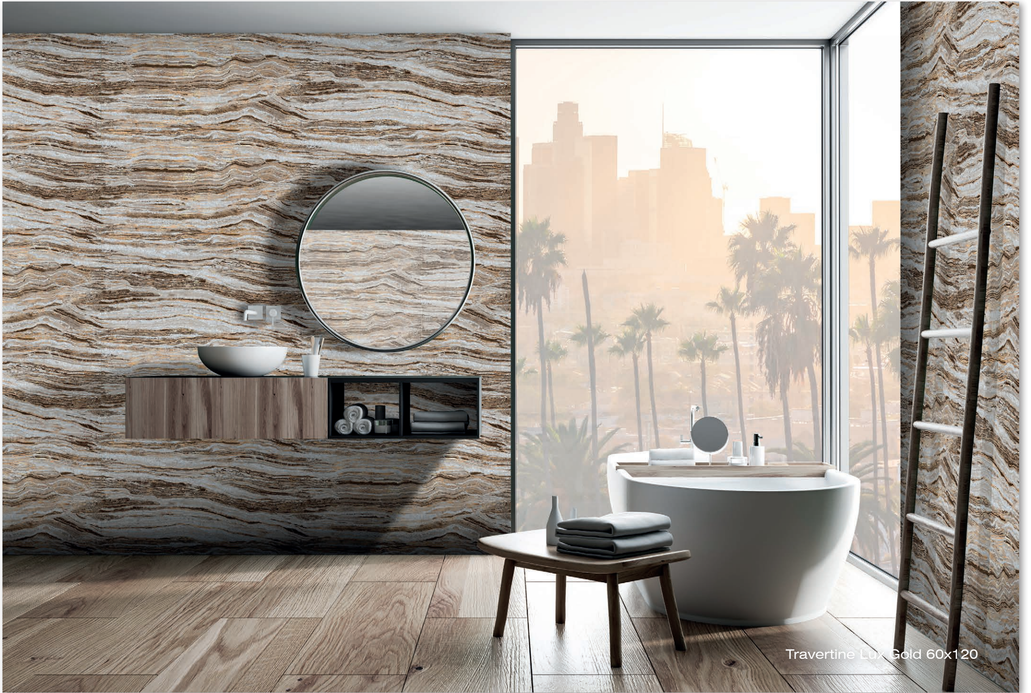
Travertine Lux Gold 60x120