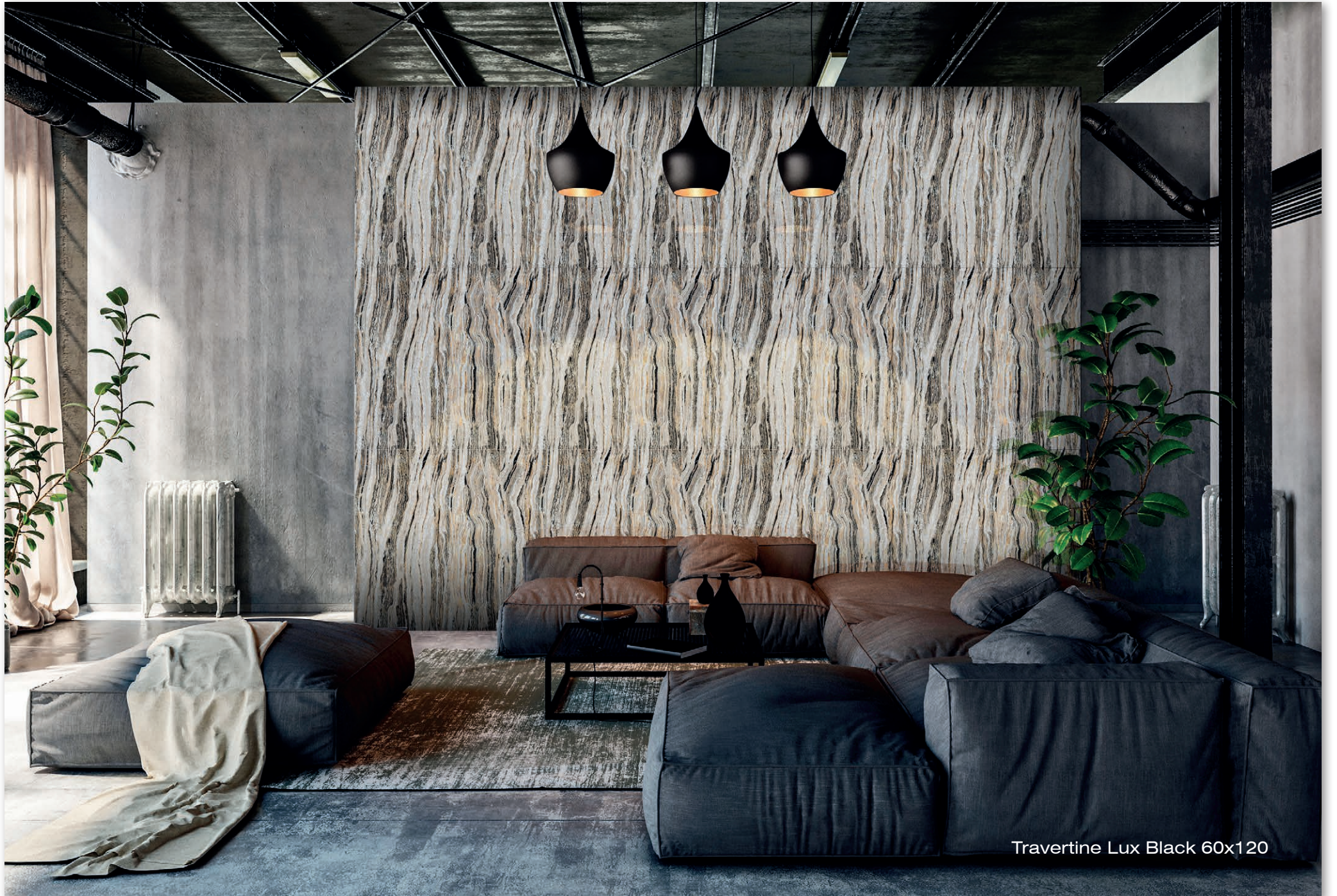
Travertine Lux Black 60x120