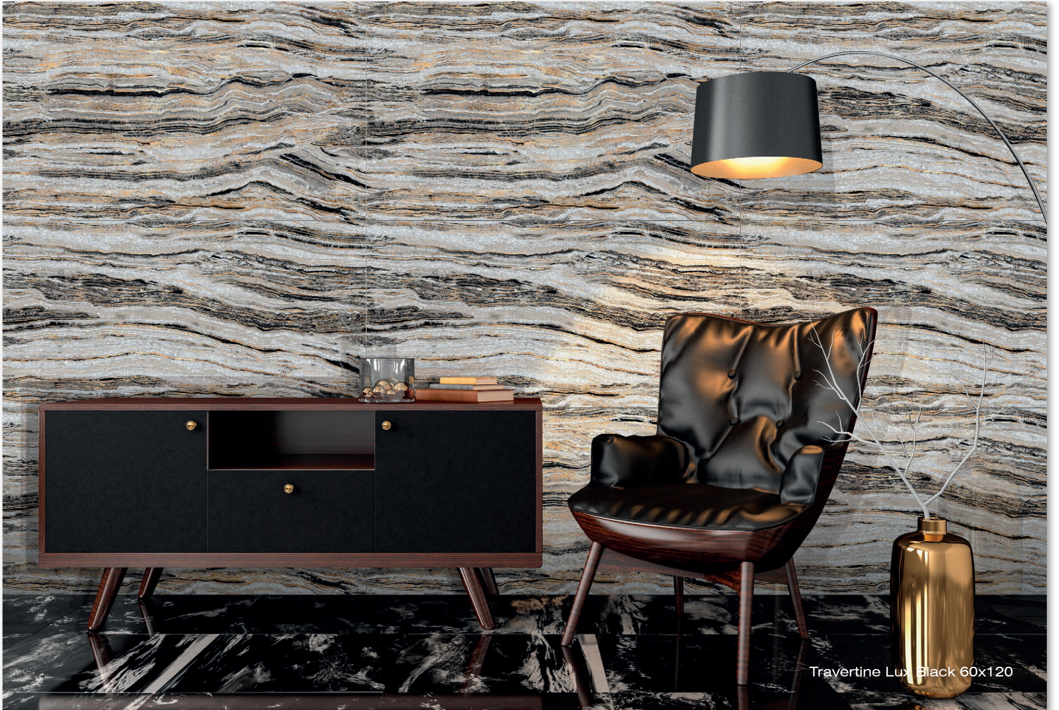
Travertine Lux Black 60x120