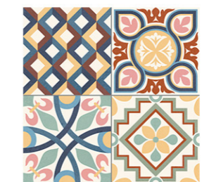
Heritage Mix 33.15x33.15 / 13"x13"