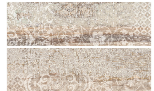
Deco Origen Miel 20.2x66.2 / 8"x26"