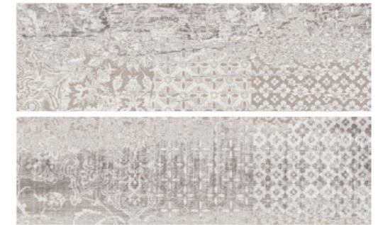
Deco Origen Gris 20.2x66.2 / 8"x26"